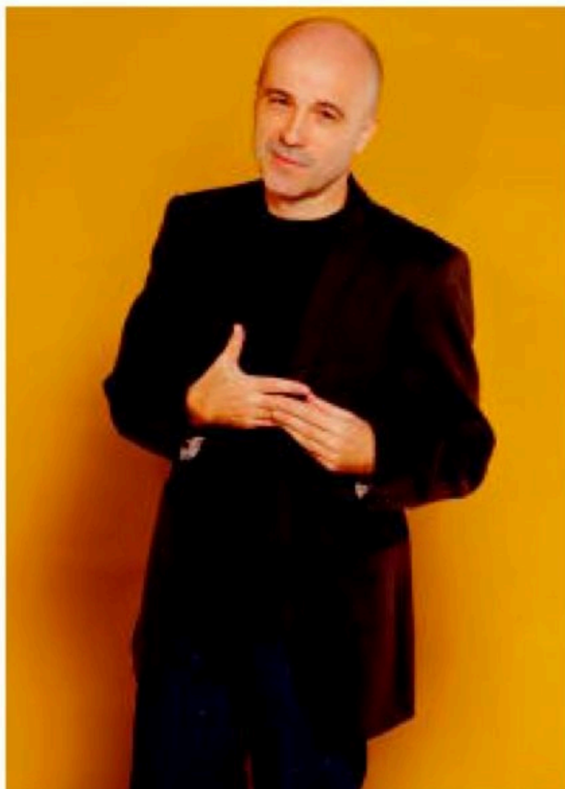
KEPA MURUAAREN ARTXIBOA

Kapitulurik ez dago, liburu osoa jarraian kontatzen baitut. Azken poema bat dago aparte, koda bat, eta atari bat ere bai, hitzaurre txiki batekin. Sinfonia gisa funtzionatzen du guztiak, hasiera eta amaiera batekin, eta oso ongi ix-